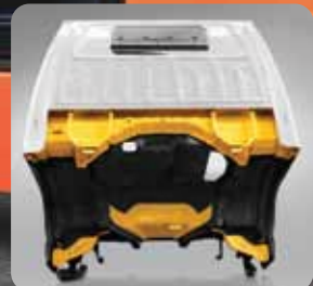
Penambahan anti karat pada cabin