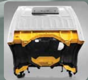
Penambahan anti karat pada cabin